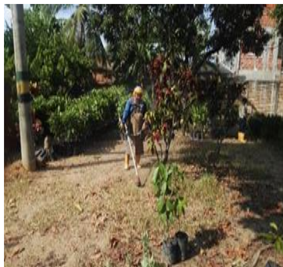
PROGRAMA DE SIEMBRA, ESTABLECIMIENTO, GERMINACIÓN Y PRODUCCIÓN DE PLÁNTULAS EN EL VIVERO