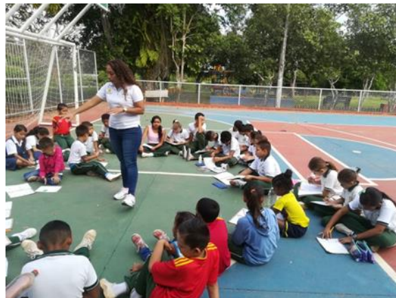
SENSIBILIZACIONES EN CENTROS EDUCATIVOS - RESIDUOS SOLIDOS