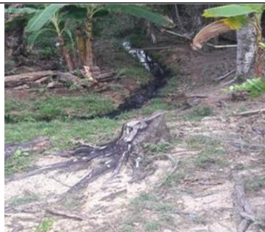
AFECTACIÓN AL RECURSO HÍDRICO